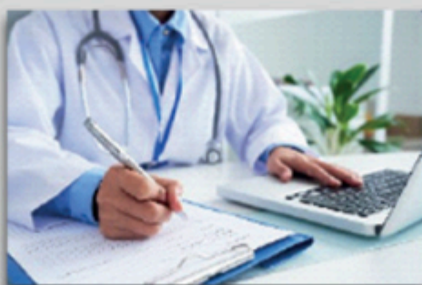
Medicina del lavoro