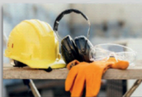
Igiene e sicurezza